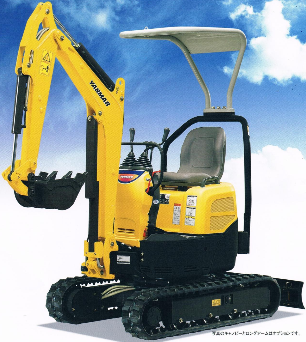
写真のキャノピーとロングアームはオプションです。